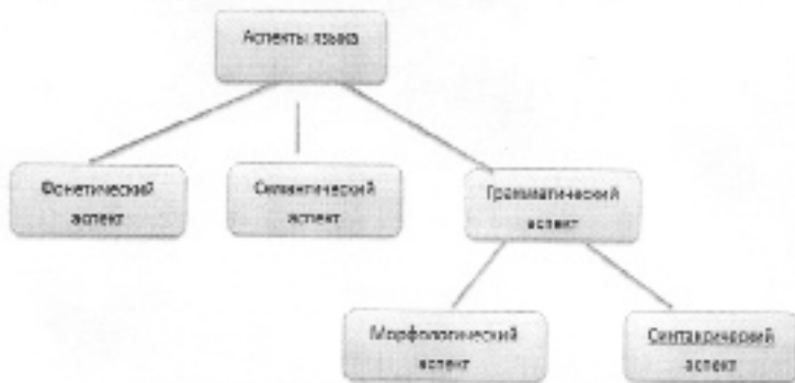
Рисунок 1- С позиции разных аспектов языка